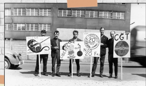
Les Dépêches, 13 novembre 1961 Archives municipales de Montbéliard

LORS DE LA GRÈVE DE 1961 CONTRE L'AUGMENTATION DES CADENCES, LA DIRECTION PEUGEOT UTILISE UN INCIDENT MINEUR POUR CASSER LE MOUVEMENT ET LE DÉTOURNER DE SON OBJECTIF.