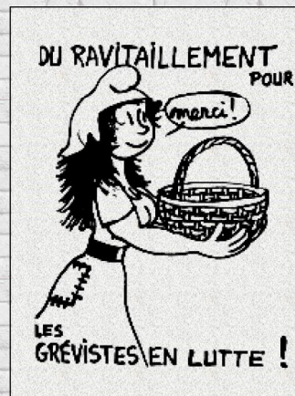
Affiches de mai 68

DANS LES USINES OCCUPÉES, LES SALARIÉS S'ORGANISENT POUR LES ROULEMENTS AUX PIQUETS DE GRÈVE, POUR ASSURER LA SÉCURITÉ DU MATÉRIEL ET LE RAVITAILLEMENT. A PEUGEOT-SOCHAUX, DES LAISSER-PASSER SONT DÉLIVRÉS AUX POMPIERS PAR L'INTERSYNDICALE.