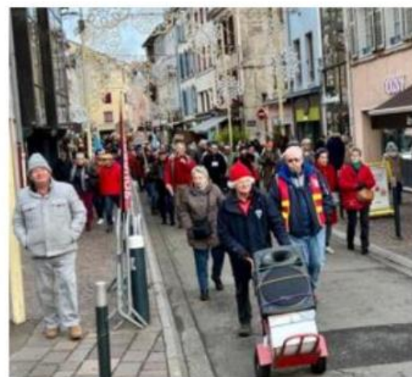
A la Une de l'Est Républicain